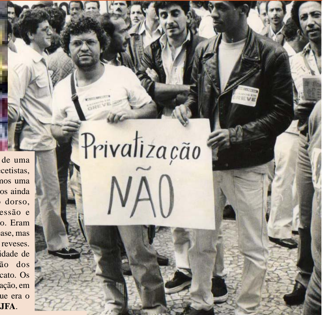
As fotos em preto e branco são de 1990, referindo-se à greve e à manifestação contra fechamento da DR em Juiz de Fora. As fotos mais recentes mostram as manifestações pelo cumprimento do Termo de Compromisso assinado em 2007, reivindicando o Adicional de Risco

Parabenizamos esta categoria, principalmente os associados, pela coragem e crença na organização sindical, sendo o único caminho para o crescimento e o respeito da classe trabalhadora.