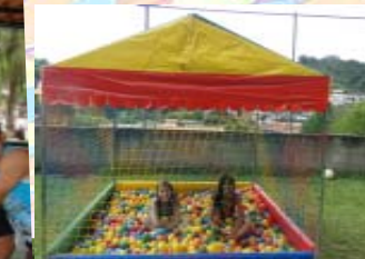
As crianças se divertiram no parque e na piscina